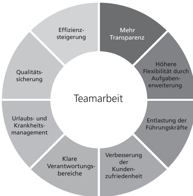
Abb. 1.1: Positive Wirkungen einer gelungenen Teamarbeit

Damit sowohl das Miteinander als auch die patientenorientierte Abstimmung von Arbeitsabläufen zwischen Pflegenden und den behandelnden Ärzten gelingt, steht der Aufbau und die Förderung einer offenen Kommunikation und eines durchgängigen Informationsflusses an erster Stelle. Gelingt die Umsetzung, der Change-Prozess, so ist zu erkennen, dass sich eigenständige Beziehungen entwickeln, Arbeitsabläufe miteinander verschmelzen und die Stimmung auf Station von allen Beteiligten als sehr positiv und angenehm empfunden wird (► Abb. 1.1). Gesteuert und definiert wird dieser Weg von der Stationsleitung in enger Abstimmung mit der Klinikleitung, sodass diese ein umfangreiches Kommunikationswissen (► Kap. 3) und ausreichende Erfahrungen in